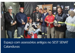
Espaço com acessórios antigos no SEST SENAT Catanduvas