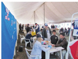
SEST SENAT oferece atendimentos na área da saúde como aferição de pressão, glicemia em comemoração ao Dia do Motorista em Três Barras.

A Unidade de Três Barras promoveu no dia 22 de julho um Café da Manhã para celebrar o Dia do Motorista, além de oferecer atendimentos gratuitos na área da saúde e informações sobre cursos legais e temas pertinentes a profissão. O evento contou com cerca de 200 participantes e confraternização com familiares.