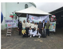
Equipe SEST SENAT de Lages participa da Festa de São Cristóvão

O SEST SENAT de Lages promoveu uma diversidade de ações durante todo o mês, para homenagear o motorista. Teve palestras, distribuição de brindes e orientações de saúde. Também foram promovidas ações em diversas empresas de transporte, além da participação na festa da Capela de São Cristóvão, com missa, carreta, bingo e churrascos.