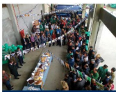
Confraternização do Dia do Motorista na empresa Fontanella, em Criciúma

O SESTSENAT de Criciúma realizou de 23 a 27 de julho ações em celebração Dia do Motorista. As atividades aconteceram para os trabalhadores do transporte, com intuito de levar informações relevantes para melhorar a qualidade de vida e cuidados na prevenção de acidentes.