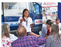
Van do SEST SENAT Blumenau participam do Motorista em Família em Joinville