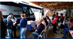
Van do SEST SENAT de Criciúma na empresa Forquinhina