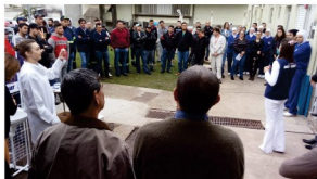
Orientações aos motoristas para uma vida mais saudável, em ação na empresa BRF de Chapecó

Durante o mês de julho foram desenvolvidas as ações de caráter preventivo, em diversas empresas do transportes. A Unidade promoveu palestras com profissionais da área da educação física, nutrição, fisioterapia e odontologia, além de ginástica laboral, saúde da coluna e alimentação saudável foram abordados durante os eventos. Para encerrar a programação, no dia 22 de julho houve uma ação em parceria com Paróquia de São Cristóvão e homenagem aos motoristas. Também houve participação da equipe do Programa Prevenção de Acidentes.