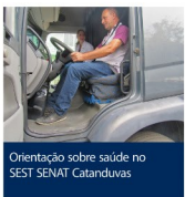
Orientação sobre saúde no SEST SENAT Catanduvas

O SEST SENAT Catanduvas elaborou a "Sala de Memórias" para comemorar o Dia do Motorista. No local foi montado um painel com fotos e adesões de caminhões antigos que trouxeram à memória dos visitantes muitas lembranças. Também teve a exposição de diversos acessórios de veículos de carga antigos, da mesma forma em que em uma sala foi projetado um vídeo com depoimentos dos empresários do setor de transporte. Houve, ainda, um evento em Joaçaba com a palestra sobre "Saúde da Coluna", mediada pelo fisioterapeuta da Unidade, que orientou os presentes com dicas de ergonomia no caminhão.